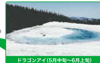
ドラゴンアイ(5月中旬~6月上旬)

その他観光コースもご用意できます。 ※価格は普通車料金です。 ※駐車料金、高速道路料金は別途となります。